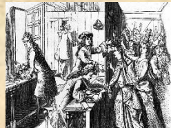
Les intendants, représentent le roi en Province